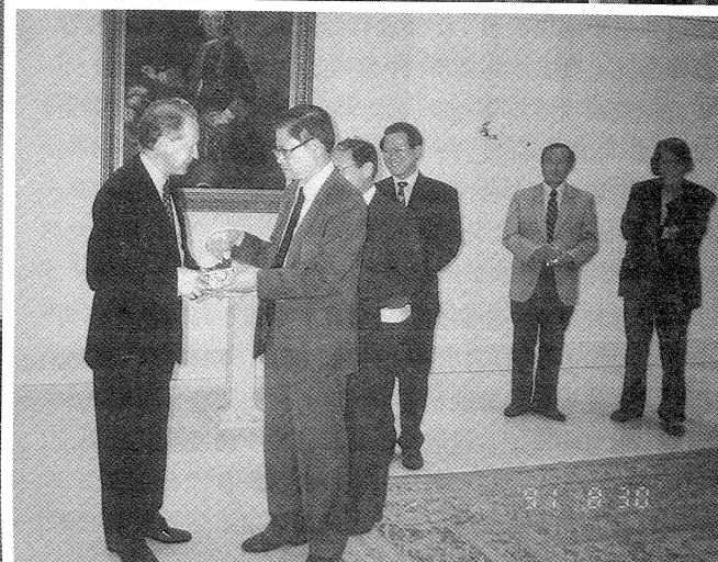
楊館長代表致贈禮品予柏林普魯士文化財團國立圖書館館長