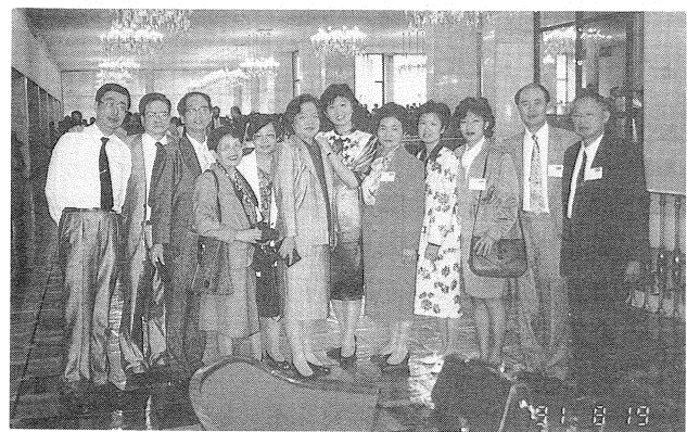
我國出席代表合影於 IFILA 大會歡迎酒會

國際圖書館協會聯盟(IFLA)為世界最大圖書館國際組織，並為聯合國教科文組織(UNESCO)支助的機構，成立於一九二七年，目的在促進國際圖書館與資訊科學之發展與合作。團體會員據統計至一九九一年已達 1,305 個，包括全球 132 國之國家圖書館、大學圖書館、學術機構、圖書館與資訊科學協會等。該會過去受聯合國教科文組織及中共的壓力，對我國會籍一再杯葛，近來經本館館長崇森積極交涉，情況已有改善，為外交上一大突破；加以近來蘇聯揚棄共