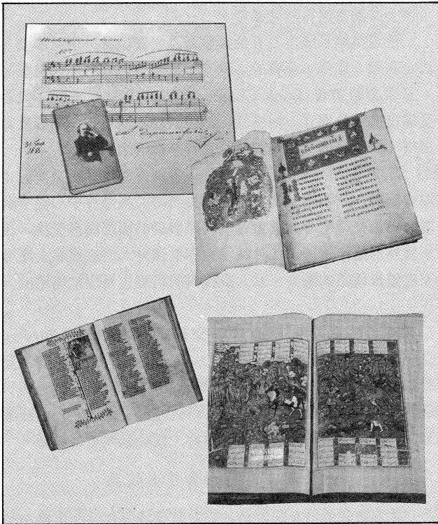
列寧格勒公共圖書館所藏手稿、善本