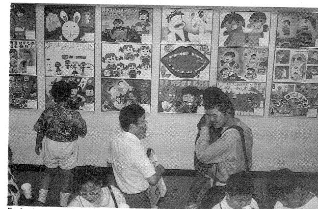
「愛護您的牙齒——口腔保健全國漫畫競賽」入選作品展覽