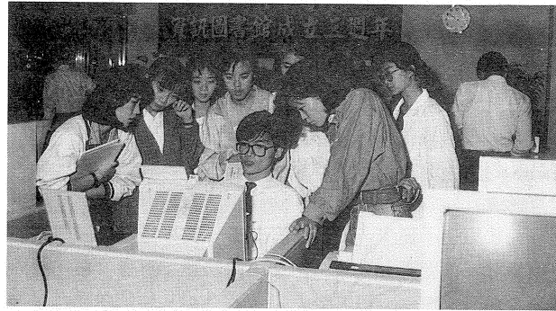
資訊圖書館龍門網路線上查詢解說服務

「資訊與電腦科技會議及展覽訊息」為資訊圖書館(以下簡稱資圖)所蒐集最具時效性之一項資訊資源。為推廣利用該特殊資訊，資圖除繼續在佈告欄上張貼每日整理出的相關活動訊息供讀者翻閱利用，並自本(八十)年八月起成為臺灣電訊網路公司(以下簡稱臺訊公司)的資訊提供者，經由其發展出的環島性個人電腦網路—龍門網，讀者可自館內外，不受地點限制，只要是網路用戶，即可隨時線上查詢該專題資料庫及該網路上的其他資訊。