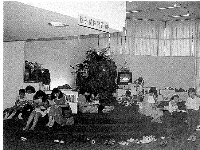
親子暨休閒區吸引不少民衆參觀

吾人對政府出版品通常都存有相當刻板的印象，咸認為它索然無味、了無生趣，而事實上並非如此，相信參觀過本屆政府出版品展覽的觀衆都會一改過去的觀感，不再認為政府出版品是曲高和寡之物，一般市井小民根本用不上的東西。本次參展機關於展期中分贈參觀民衆的書刊，索贈一空，