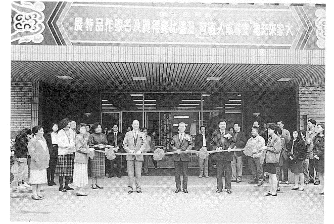
教育部場主任秘書國賜為「宣導成人教育」漫畫展剪綵