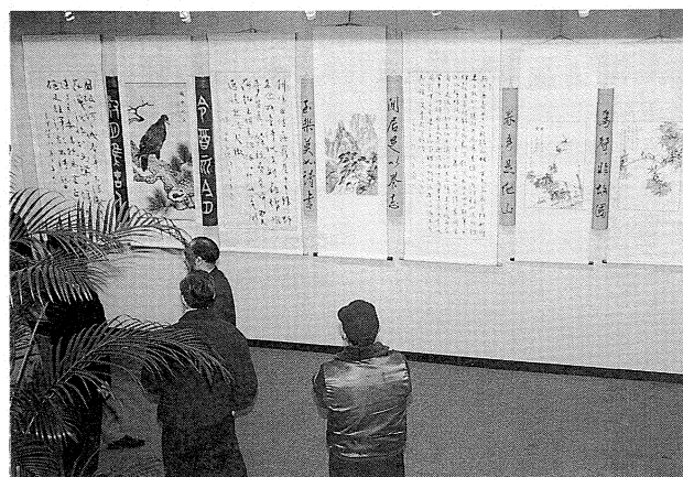
臺灣分館一樓大廳舉辦「神州書畫、竹雕、篆刻聯展」