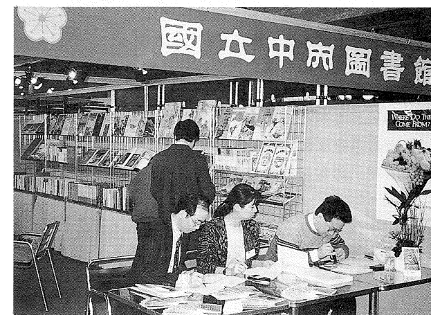
一九九二年布魯塞爾國際書展本館攤位