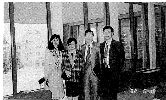
本館一行四人參觀華盛頓大學圖書館

華大的手稿及檔案室所蒐集的資料類型非常多樣化，各主題下集了相關的手稿、文件、圖片、海報、剪報及錄音帶等。這些資料在不同的人名下，分置數個檔案夾，然後依類放入特殊規格的紙盒中，再予以編號，讀者則依館員製作