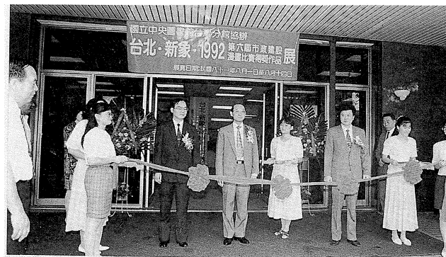
第六屆市政建設漫畫比賽得獎作品展

為方便讀者利用分館館藏，分館最近重新修訂「館藏書刊借印出版管理辦法」及「館藏圖書資料縮影及複製微捲申請辦法」；又為使分館一樓展示廳充分使用，並發揮其社教功能，特訂定「國立中央圖書館臺灣分館申請展示作業要點」。茲將其內容節要刊出，歡迎各界申請利用。