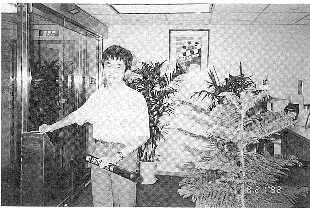
資訊圖書館採行刷卡進館，讀者稱便

本次國際研討會，希望發表論文者，能儘早提供論文，俾便打印，並先寄發給與會者閱讀，每篇論文經過仔細研讀後，研討之內容會更充實，氣氛也更熱烈。會後將出版論文集發行。(辜瑞蘭)