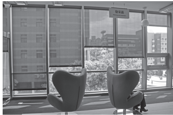
（圖10）發呆區：可提供讀者一個思緒放空、沉澱或重整的空間

四、極富創意的空間命名：例如清沙龍（以藝文集會之「沙龍」為名，期許成為清華人推廣與閱讀分享之重要場域）（圖9）、知識集（以行