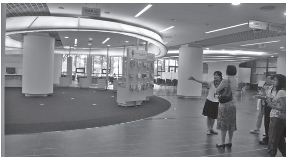
(圖4) 知識集：提供豐富館藏與服務的展示櫥窗

二、智慧型貼心服務設計：UHF RFID智慧型圖書管理系統（圖6），可提供自助式借還書服務；智慧型RFID安全置物櫃系統（圖7），藉由影像辨識提供借用與歸還服務；整合式空間管理系統，則提供多種空間與席位透過Web及Kiosk（資訊站）進行預約與報到服務，並透過電源與空調的控管，如座位採靠卡後開通網路、電源；空間仿飯店管理模式，靠卡後開啓