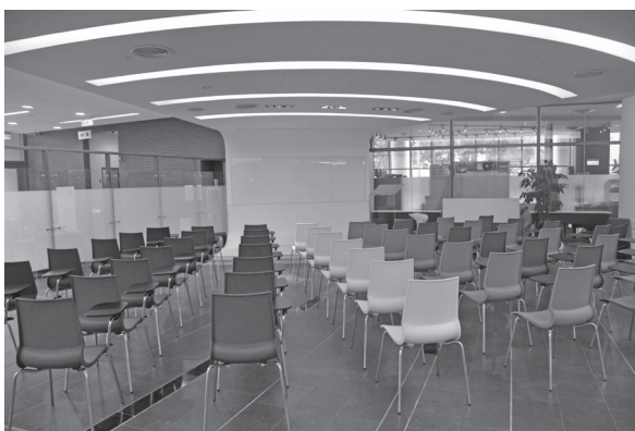
（圖9）清沙龍：專為知識分享設計的場域