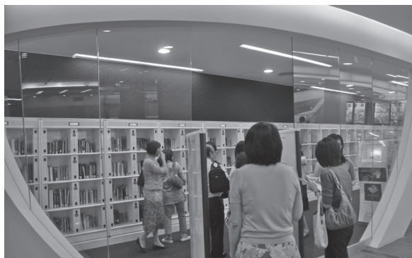
(圖6) 智慧型書架自助預約取書