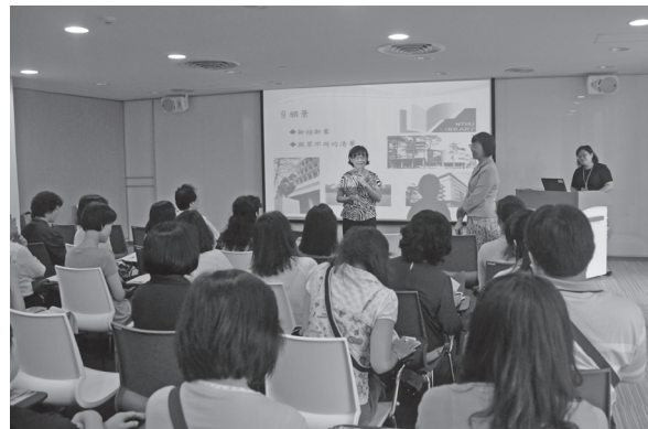
（圖3）兩館人員進行意見交流