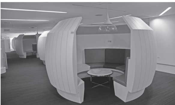
(圖5) 視聽服務：多人聆聽席