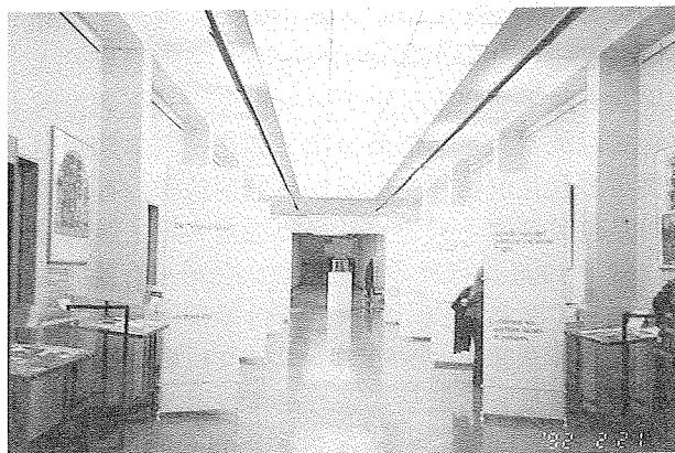
瑞士國家圖書館展覽廳