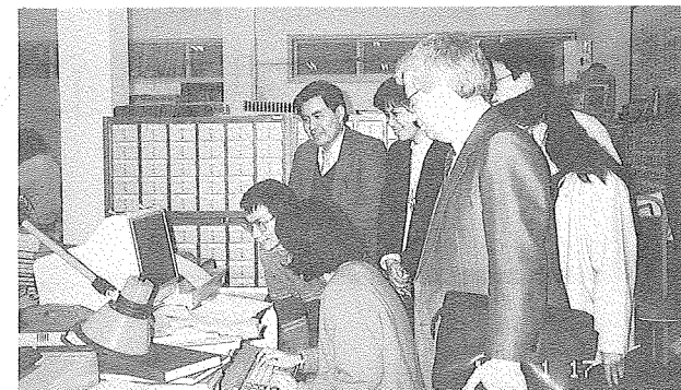
為推動全國圖書資訊網路，本館陪同 UTLAS 公司人員參觀合作館中央大學使用網路情形

(三)改善自動化作業、實現書目共享：本館約在民國 70 年間開始規劃推動館內自動化系統，並會同圖書館界共同研訂自動化所需之各項準則，如機讀編目格式、中國編目規則等，目前已完成圖書建檔量約近