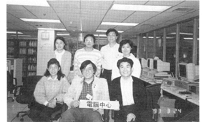
電腦中心同仁合影於辦公室