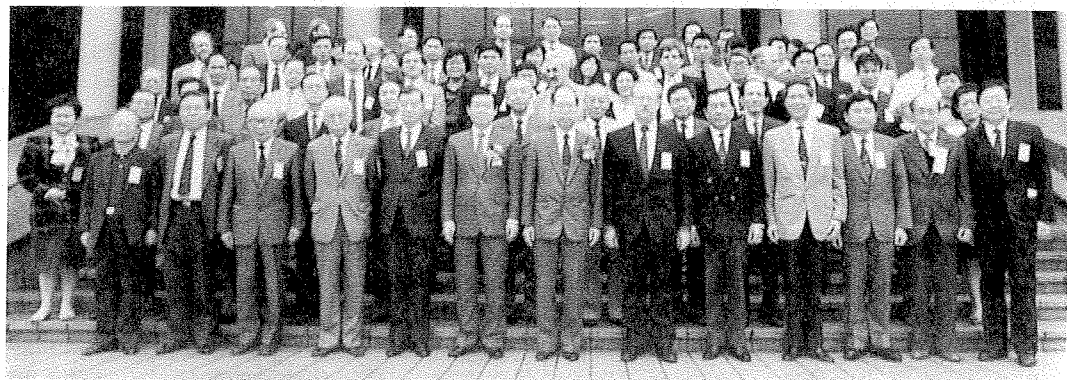
「民間信仰與中國文化國際研討會」與會代表合影

而後進一步考究道藏經，又找到許多其他例證。大部分的民間崇拜缺乏歷史典籍，因此道藏所保存的資料就尤其重要，它為民間信仰研究提供了歷史的透視，並有助於對民間宗教進行社會學分析，進一步了解民間崇拜在中國文化中的地位。