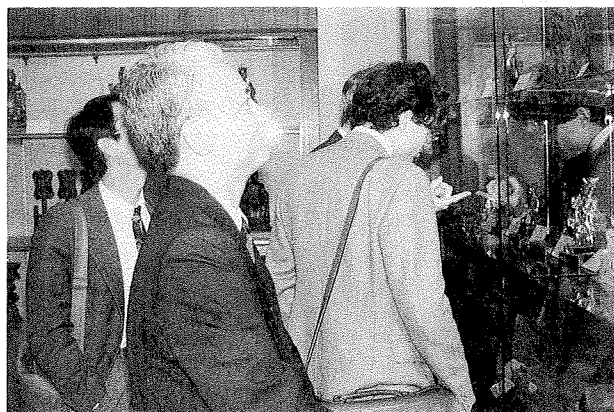
與會代表赴臺灣分館參觀「臺灣民俗器物展覽」