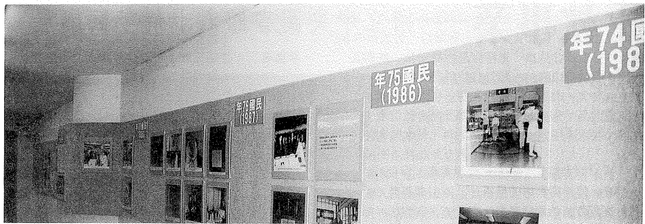
「千秋事業展」按年排比，以照片和文字回顧本館六十年來重要活動