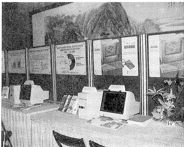
「資訊網路展」於文教區三樓國際會議廳旁舉辦