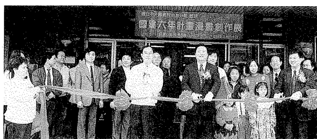
「國建六年計畫漫畫創作展」開幕剪綵