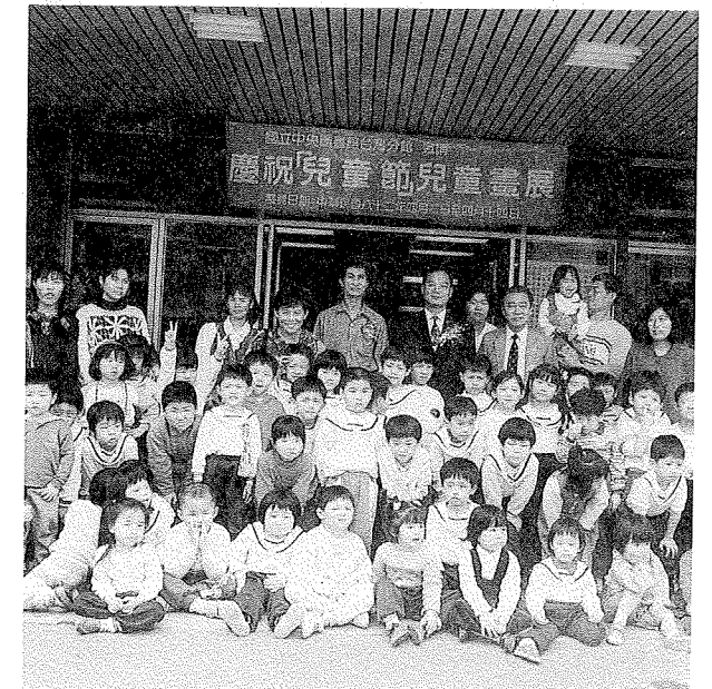
慶祝兒童節，臺灣分館舉辦兒童畫展