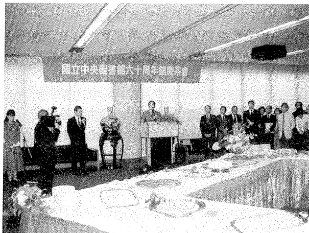
教育部李建興次長(致詞者)蒞臨本館六十周年館慶茶會