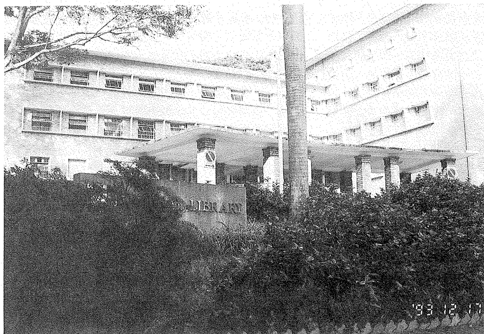
新加坡國家圖書館外觀

，原則上，該館藏書是可借出館外的。在閱覽區，大部分書籍、刊物是開架式的陳列，可由讀者自行借閱，而另有部分存放於書庫者，則需透過館員始得借出。藏書的語言別有四種——中文、英文、馬來文及坦米爾語(Tamil)。目前該館已提供有「線上公用目錄查詢」(OPAC)，唯只有英文及馬來文資料鍵入此目錄，而中文及坦米爾語資料的電腦化處理技術仍在研發中，現階段依舊沿用卡片目錄查詢。它們也有所謂的「特藏」(SEA Collection: Southeast Asia Collection)，凡是有關新加坡歷史發展的文獻，藝術、文化、企業等各方面發展的資料及新加坡政府公報皆收藏於此。為了取得這些有意義的資料，除了從私人收藏家處購得外，也和大英圖書館磋商購買早期新加坡出版品的微捲。特別收藏有一套珍稀的「十九世紀新加坡圖像集」(Collection of Nineteenth Century Photographs of Singapore)，是他們頗為自豪的。