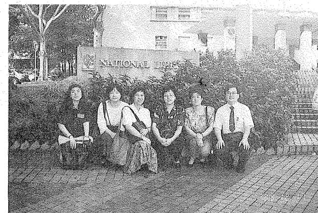
本館同人參觀新加坡國家圖書館合影於門前

由總館統一採訪與編日後分送各館，再由各分館負責公共借閱服務。該館原本只有八所分館，而第九所分館是於1993年11月正式啟用，加入了國家圖書館的行列中。