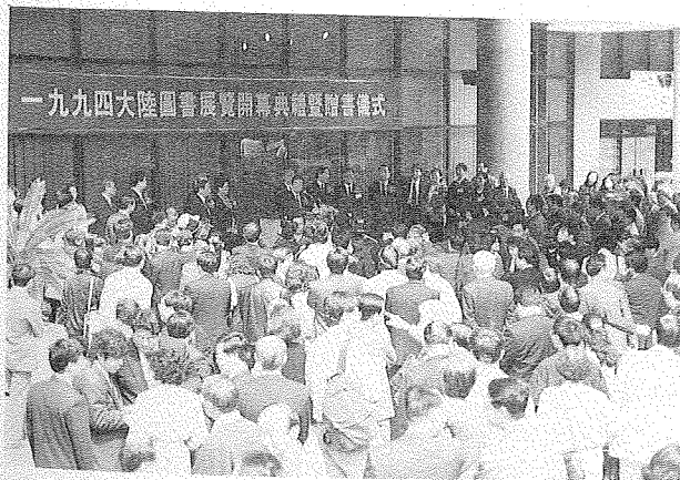
開幕典禮於本館室外中庭舉行，嘉賓雲集

為使參觀民眾對會場的動線一目瞭然，特在展場入口處內設置大型不銹鋼組合架，標示整個展場之分區與各出版社攤位平面圖，會場內外多處，亦皆規劃導引指標，清楚地引導民眾參觀方向。展場共分三區，第一區為 1~12 攤位，第二區為 13~43 攤位，第三區為 45~99 攤位。另外，在展場入口、出口處分別設有一服務臺，提供書展單張平面圖及有關諮詢服務，參觀民眾詢問頻繁。出口處並裝置一套防竊系統，