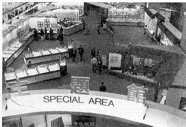
主題館以「尋根探源——出版事業在臺灣地區的演進」為題