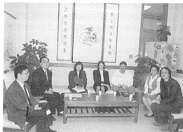
澳洲國家圖書館等一行三人參觀拜會臺灣分館