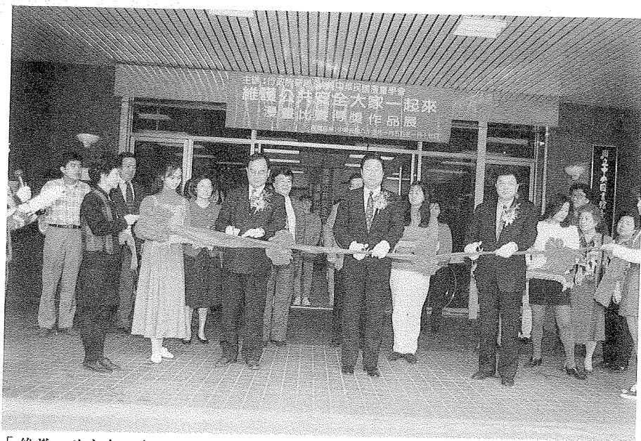
「維護公共安全漫畫比賽得獎作品展」開幕剪綵