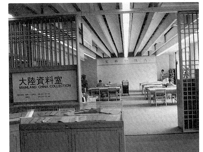
位於本館六樓的大陸資料室設置閱覽座位 28 席

大陸施行「中國標準書號」以前，係採用「全國統一書號」（1956-86 年間）。該號由圖書分類法、出版社代號和圖書種次號構成，分類號和出版社代號合組，種次號單獨為一組，兩者之間用「·」隔開。其中分類號係採用「中國人民大學圖書館圖書分類法」（以下簡稱「人大法」）的基本大類號碼（凡 17 大類），居書號最左邊，佔一至二位數；出版社代號居書號的中間，佔三位數；種次號係表示出版社所出版該類