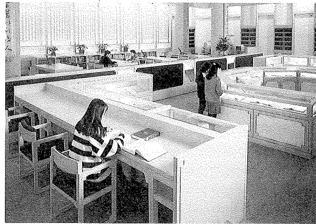
中央圖書館古色古香的善本書室

顧名思義，特藏組的特色，正在於善本書庫中與一般圖書不同的收藏，目前這些收藏主要包括善本古書 12 萬 5 千多冊、普通線裝本古書 6 萬多冊，漢簡 30 枚、金石拓片 1 萬 1 千 7 百多幅、木版年畫 1 千 8 百多張、刻書版片及各種印模凡 51 件，都是具備歷史意義的文獻或文物，應該妥加維護、整理，以有助於傳統文化的研究。其中善本古書，指明代以前及少數清代的圖書，大抵年代久遠，在學術性或藝術性方