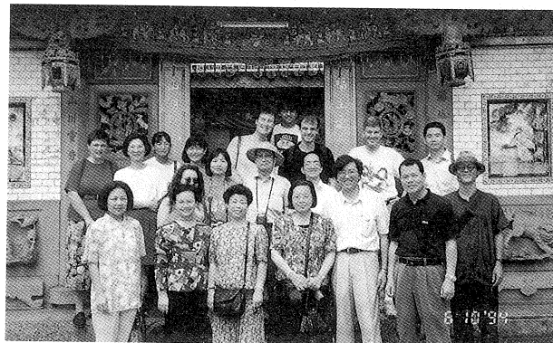
漢學研究中心文化參觀活動舉辦九份之旅，合影於福山宮前

活動內容及行程，先至小金瓜金礦露頭探源，欣賞九份獨特的礦區風光，再沿福山宮(日據時代全省最大的土地公廟)、聖明宮(奉祀關公、媽祖，為當地的信仰中心)，後經由豎崎路、基山街、輕便路以及汽車路四條九份主要街道，參觀五番坑口的昔日金礦坑，在這裡聽到許多有關採金、偷金及兼併礦坑的傳說與趣聞。此外，如全省第一家戲院——昇平戲院、萬姓公祠、彭園等等，都各具特色，令人發思古之幽情，深獲來華學人之肯定，紛紛表示九份山城之旅，使他們瞭解臺灣採金史，同時藉由解說更可增加對臺灣的民間信仰、建築特色有進一步的認識，大家都興奮的覺得不虛此行！(阮靜玲)