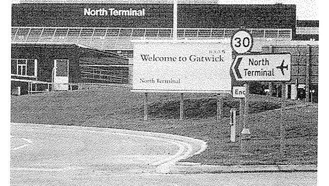
英國Waterstones圖書公司在倫敦Gatwick機場開設世界最大的機場書店

英國著名的水石(Waterstones)圖書公司更將於今年年底在倫敦蓋威克(Gatwick)國際機場開設一家世界最大的機場書店。蓋威克機場目前已有13家書店，不過水石這個佔地3千平方英尺的書店將是最大的，它位於機場北候機室的免稅商區，銷售圖書將以暢銷書及大眾市場平裝書為主，旅遊書也是重點之一。設立機場書店，是水石公司本年度投資500萬英鎊的