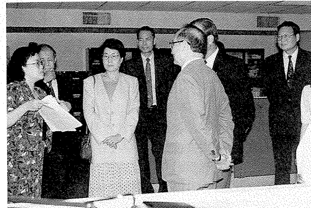
監察院教育委員會委員至本館巡察