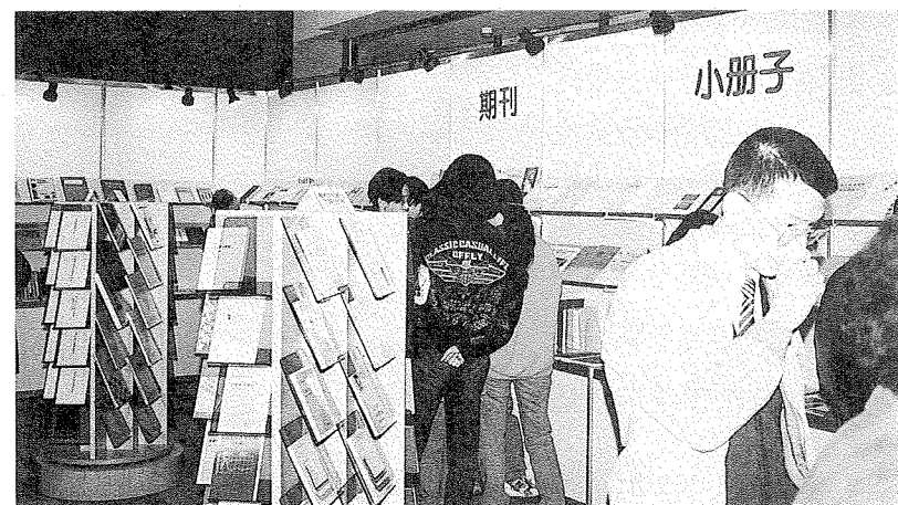
展品分類陳列，井然有序