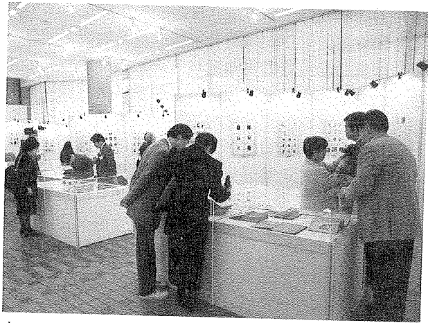
臺北國際藏書票大展假本館展覽廳舉行

本館曾館長濟羣主持開幕剪綵及致詞。曾館長說，藏書票顧名思義，和藏書有所關連，它是枚小張的