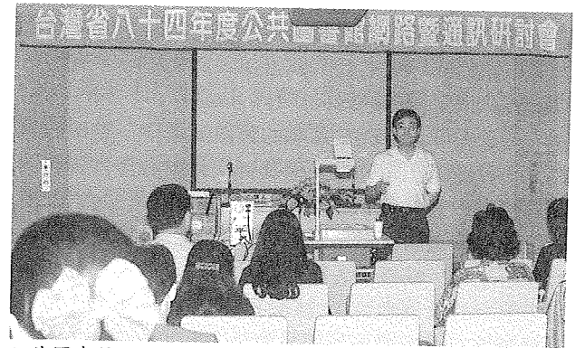
公共圖書館網路暨通訊研討會在本館簡報室舉行

「臺灣省84年度公共圖書館網路暨通訊研討會」於5月29日至30日，在中央圖書館簡報室舉行，此項由臺灣省政府教育廳主辦，本館書目資訊中心受託承辦的研討會，共有全省20所文化中心圖書館館員、網路及系統管理人員計40餘名報名參加。研習內容包括電腦基本概論、網路通訊基本概論、連線建構方法、臺灣學術網路資源、全國圖書資訊網路介紹、電腦中文系統與離線作業、實際操作及座談等。