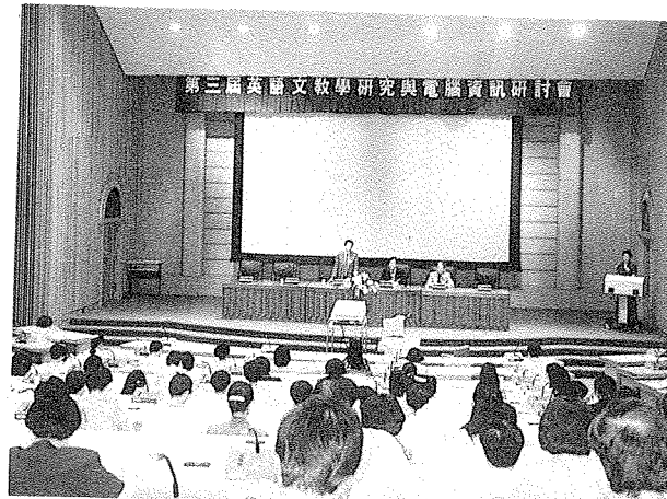
英語文教學研究與電腦資訊研討會於本館會議廳盛大召開