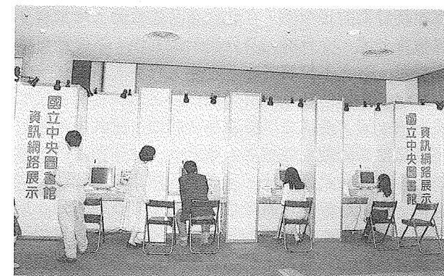
慶祝建館62周年，本館舉辦資訊網路系統展

曾館長更在館慶記者會中表示，自去年10月正式啟用「國立中央圖書館資訊網路系統」以來，每天利用電話撥接進入本館網路查閱資料的已超過4百人次。目前的8條電話線路已不敷使用，為加強服務社會大眾，預計自今年7月起將電話專線擴增為35線，以進一步服務讀者，歡迎各界多加利用。(簡家幸)