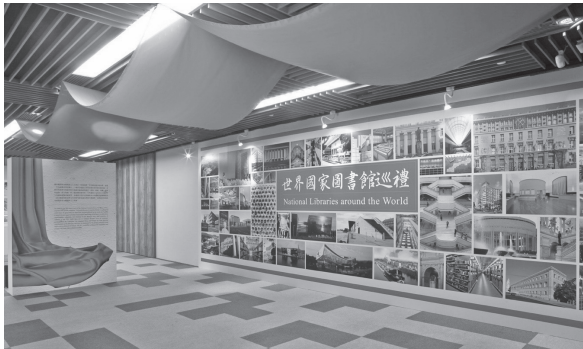
世界國家圖書館巡禮入口—圖書館建築圖像牆