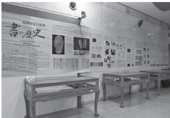
書的歷史—大型說明背板與文物展示櫃

除了現場實體展出之外，本展覽亦規劃主題網頁，提供民眾線上瀏覽 http://goo.gl/WgA4YX 與電子書 http://goo.gl/eDVgUd ，如臨實境觀展。