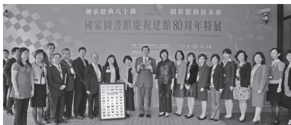
總統馬英九先生、黃碧端政務次長與本館曾淑賢館長暨同仁於特展海報前合影

特展於4月18日上午10點於展覽廳揭幕，現場除了總統馬英九先生、教育部黃碧端政務次長、本