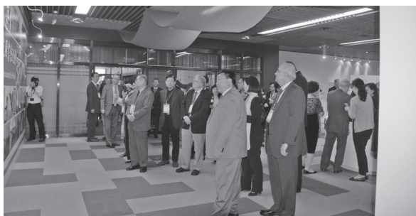
國內外貴賓於揭幕儀式後參觀「世界國家圖書館巡禮」展覽