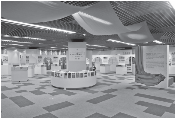
世界國家圖書館巡禮—圖書館簡介與出版品資料展示區