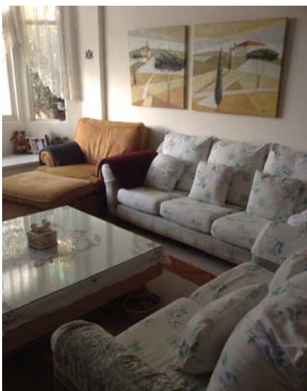
圖、全家各據一角悅讀的客廳

太多太多的好書真的很難一言道盡，我常努力的推廣書本所帶來的價值，也真的要感謝文化局圖書館給我們讀著的美好閱讀經驗，以及專業有耐心的圖書館館員提供給我們最佳的借書服務！