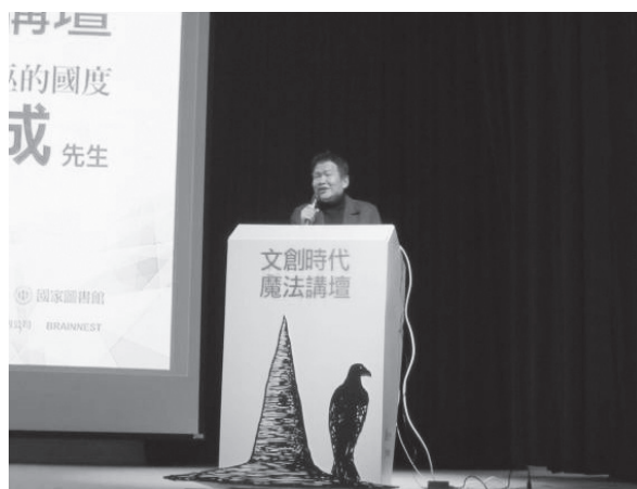
羅智成老師為大家帶來「巫師與女巫的國度」

2月19日魔法講壇的首場演講，邀請具有詩人、作家身分、現任臺灣創新發展公司策略長，同時也是前臺北市新聞局長、中央社社長的羅智成，為我們帶來「巫師與女巫的國度」。羅智成稱之為「巫師」或「女巫」的人，將是文化創意年代引領風潮的人種。他們似乎永遠不會被眼前冰冷的現實擋住夢想的視野，甚至擁有微型魔法（藉由創意、態度與信念），為身邊的人們帶來驚喜與感動，進而也相信了魔法…或生活上其他可能、其他選擇的存在。