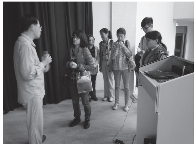
演講活動結束後，現場民眾依依不捨、把握時間與講師合影留念並提問