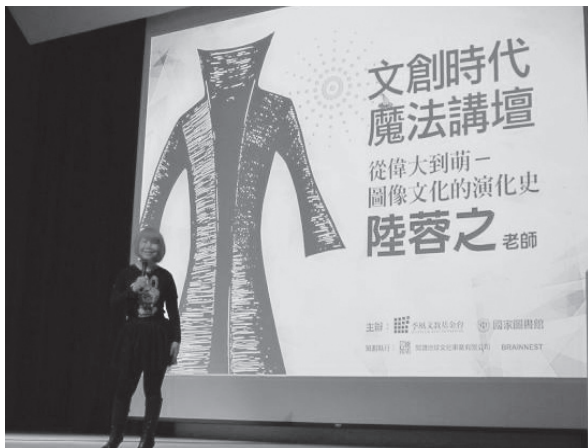
充滿個人魅力的陸蓉之老師

2月26日由知名評論家、策展人、藝術家、上海當代藝術館創意總監，並擔任實踐大學媒體傳達設計系專任教授的陸蓉之老師，跟大家分享她保持清純無敵、活力不敗的秘訣。