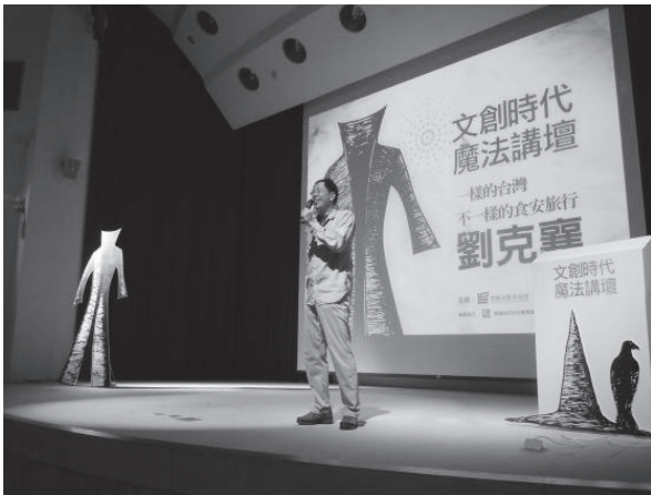
劉克襄老師為聽眾帶來精彩演說