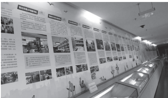
兩岸公共圖書館事業發展聯展會場一隅