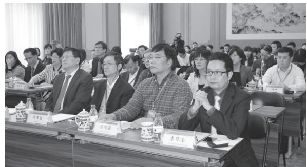
兩岸公共圖書館同道齊聚一堂，討論公共圖書館經營管理與閱讀推廣