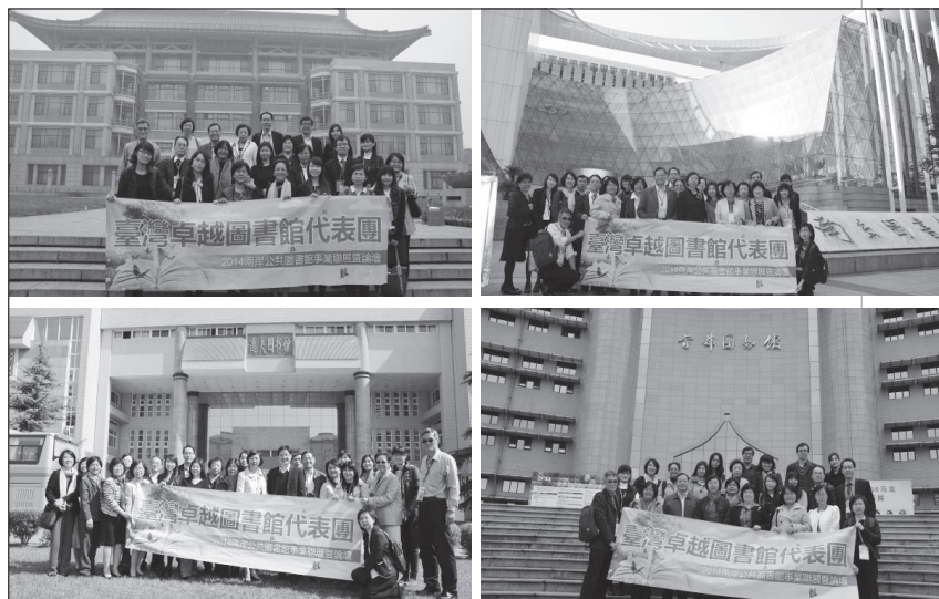
由2013年全國公共圖書館評鑑中，獲得年度圖書館獎及特色圖書館獎之公共圖書館館長及主任所組成的臺灣卓越圖書館代表團，於各參訪圖書館前留影。