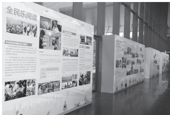
兩岸公共圖書館事業發展聯展會場一隅